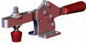
237-U Base di fissaggio piegata Braccio ad U